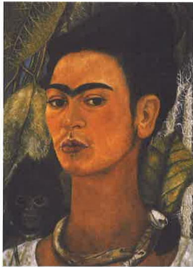
Autorretrato de Frida Kahlo

Frida Kahlo mantuvo hacia el pintor Diego Rivera un amor incondicional a pesar de que él era 'gordo, feo, bohemio, comunista, ateo,