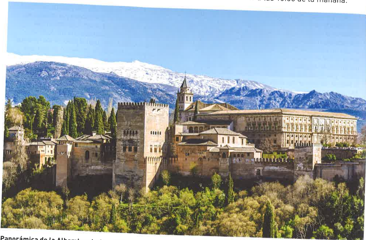
Panorámica de la Alhambra de Granada