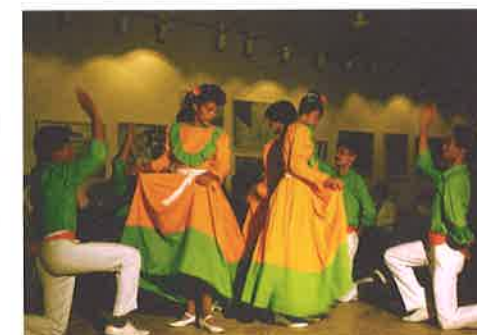
El merengue dominicano