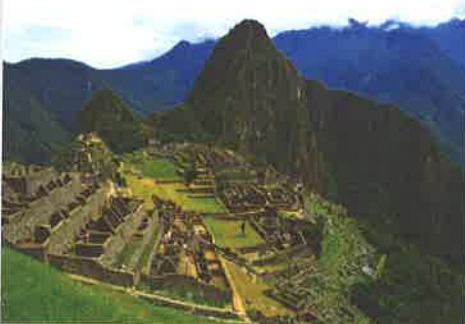
Vista panorámica de Machu Picchu