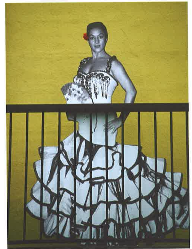
Lola Flores, 'la Faraona'

Creo que hay alguien que es el Dios del flamenco al que todos le debemos mucho. Estoy hablando de Camarón de la Isla. En la película Casa Flora actuó con mi madre y tiene nueve discos con el mejor guitarrista flamenco de la historia: Paco de Lucía. La voz de Camarón es especial, te emociona y te envuelve y no puedes dejar de escuchar. Él es flamenco en estado (8 ..... ).