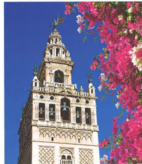
Parte superior de La Giralda en Sevilla