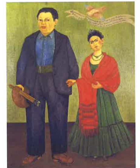
Diego y Frida el día de su boda, Frida Kahlo, 1937