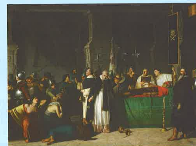
El funeral de Atahualpa de Luis Montero

Los españoles, en posesión del territorio de Perú, con enormes riquezas en oro y plata, se disputaron el poder en luchas encarnizadas en las que Pizarro perdió la vida en 1541. Ahora la historia recuerda a Pizarro como el conquistador heroico que luchó por la corona y venció a 40.000 incas con 200 españoles... ¿o como un asesino sanguinario responsable de un genocidio?