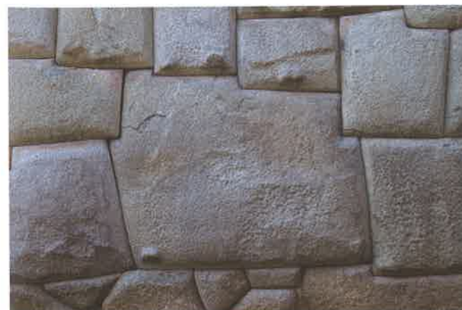
Detalle de un muro inca