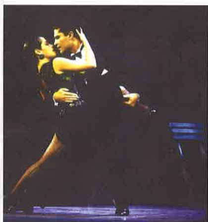
Una pareja bailando el tango