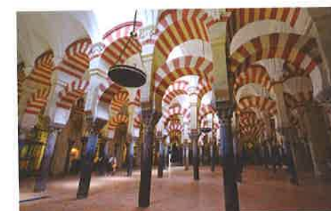
La Gran Mezquita de Córdoba