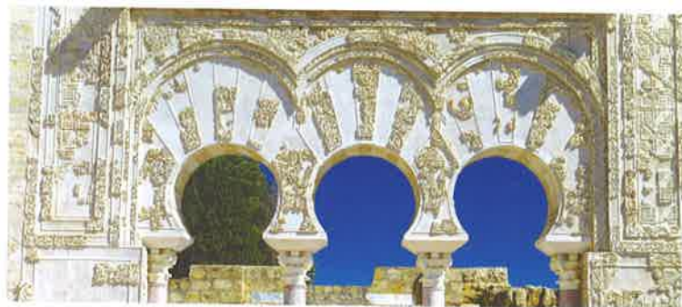
Detalle de la casa de Yafar