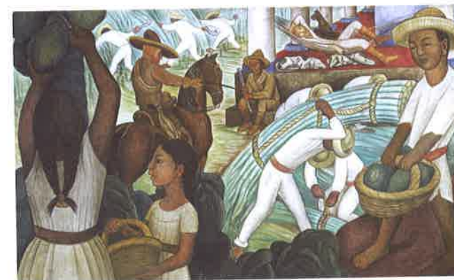
Caña de azúcar, Diego Rivera, 1931

No hay nada más explícito que contemplar algunos de los murales de Diego Rivera que son tan bellos, llamativos y abiertos a diferentes perspectivas. Diego quiso representar la historia mexicana para recordar sus raíces. Las tareas domésticas cotidianas de los mexicanos están presentes en su obra, así como el campo, las flores, la tierra; toda la esencia del país. No hay que olvidar que Rivera perteneció al Partido Comunista durante muchos años y mucha gente ve en sus pinturas una protesta y una enseñanza al mismo tiempo.