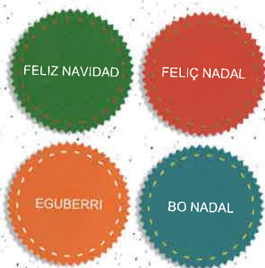
Una felicitación cuatrilingüe

2 a Lee la información sobre las lenguas cooficiales de España, luego decide si cada una de las siguientes frases es verdadera (V), falsa (F) o no se menciona (N).