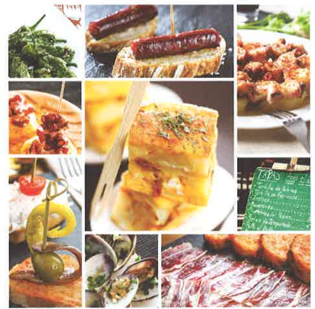
Las tapas en España

Día uno Empecé mi viaje en Andalucía. En Granada descubrí que las tapas se sirven gratis en bares y acompañan a una cerveza fría o un vino normalmente. ¡Hay tanta variedad que no sé por dónde empezar! Calamares fritos, mejillones en escabeche, tortilla de patata y chorizo o jamón serrano de muy alta calidad.