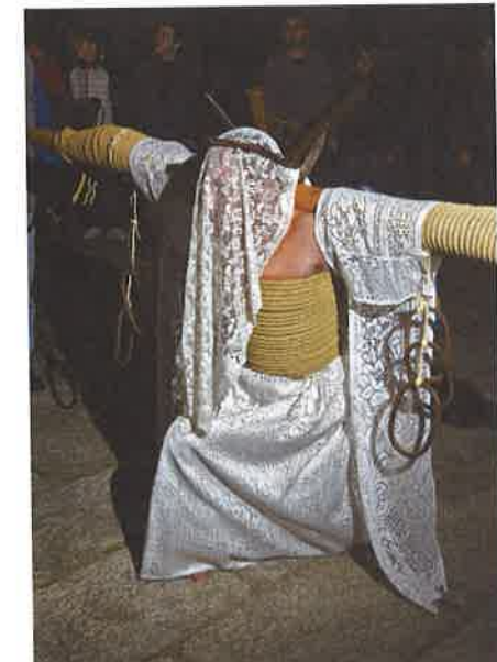
Un 'empalao' en Valverde de la Vera

No pude creer lo que víeron mis ojos al llegar al pueblo de Valverde de la Vera. Allí, tienen una tradición que consiste en un grupo de hombres que pasean por las calles atados con gruesas cuerdas a un madero en forma de cruz para mostrar su respeto a Jesucristo. Me sentí tan asombrado que no fui capaz de sacar fotos, solo mirar fijamente. Todo el mundo pareció entender este ritual, y respetó a los hombres en completo silencio, pero yo todavía estoy sorprendido de algo tan extremo y brutal.