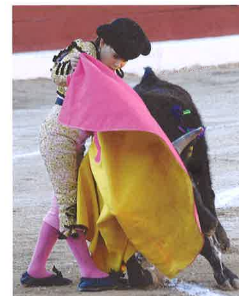
Michelito, uno de los niños toreros más famosos en México