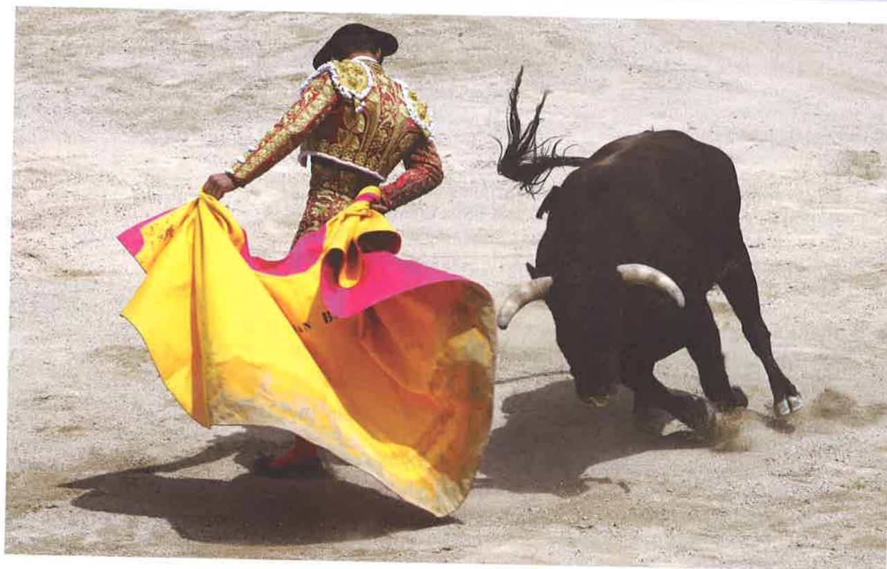
Un torero lidiando al toro

Más respuestas negativas: ¡Para ti, el entretenimiento y la libertad de elección son más importantes!