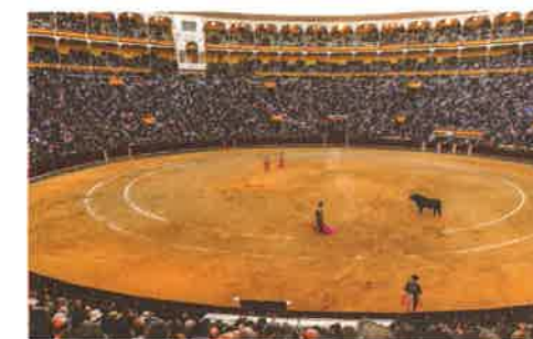
Una vista del ruedo desde las gradas