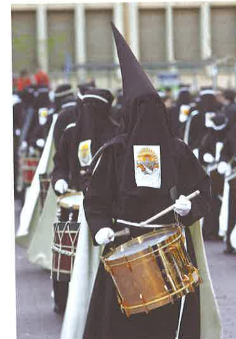
Un nazareno con capirote negro