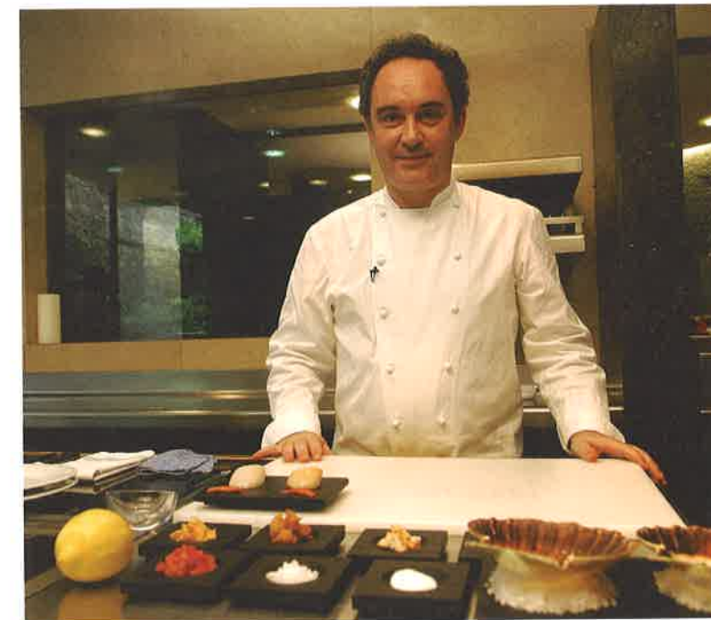
Ferran Adrià, un genio de alto nivel

6 b Elige una de las opiniones y defiéndela. Tu compañero/a de clase puede defender la otra opinión.