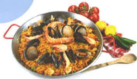
Una paella de mariscos

2 a Lee las notas que el chileno Fruela Gil tomó en su viaje a España sobre sus experiencias gastronómicas, y escribe el día (1-5) que corresponde a cada una de las siguientes frases.