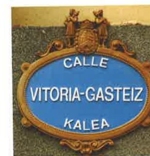
Placa bilingüe castellano-euskera