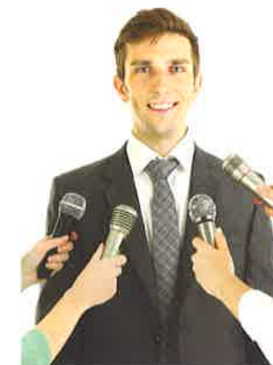
Un político joven