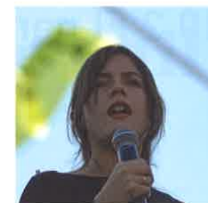
Camila Vallejo, joven activista chilena