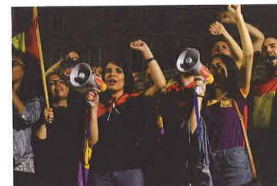
Unos jóvenes con inquietudes políticas se manifiestan

Texto adaptado de: A. Larrañeta, 'Crece el interés de los jóvenes españoles por la política aunque reniegan más de los partidos', 20minutos.es, 9 de abril de 2015