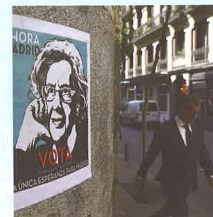
Un cartel de Manuela Carmena

Hoy en día los jóvenes estamos más lejos de conseguir nuestros sueños que (1 ..... ) antes. Mi sociedad ideal sería una en la que todos los ciudadanos tuvieran asegurados dos principios básicos para cualquiera: casa y trabajo, para al menos vivir con dignidad en la sociedad contemporánea. Hace un mes, la (2 ..... ) alcaldesa de Madrid, Manuela Carmena, devolvió 2.086 viviendas sociales a sus inquilinos después de casi (3 ..... ) vendidas a fondos de inversión. Con noticias como esta, se puede decir que quizás un futuro ideal no esté tan lejos. ¡Basta de tanta negatividad!