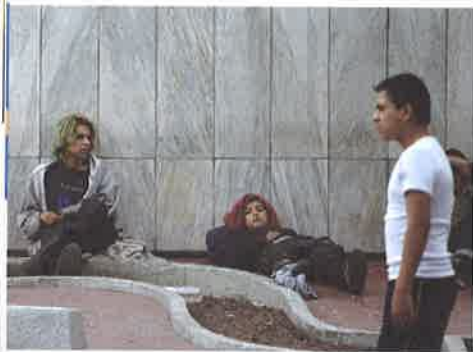
Unos 'ninis' mexicanos — ni estudian, ni trabajan