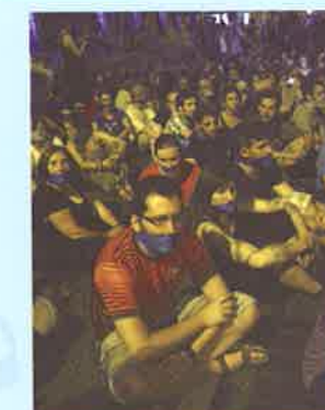
Una manifestación silenciosa en contra de la 'Ley Mordaza' española

Lo más importante es la libertad de expresión. Una sociedad que no puede expresarse libremente está atada de pies y (4 ..... ). Se habla últimamente sobre la nueva ley que el gobierno puso en (5 ..... ) el primero de julio de 2015. Se la conoce con el nombre de 'Ley Mordaza' y veta la libertad de expresión de manera brutal. Se prohíbe, entre otras muchas cosas, manifestarse ante edificios públicos o negarse a disolver reuniones en la calle. Si bien esta ley de seguridad ciudadana también castiga la violencia callejera, me parece que es un intento malintencionado por controlar y tapar la (6 ..... ) de tantos jóvenes, porque al gobierno no le conviene que estos jóvenes se manifiesten en contra de las medidas de austeridad o la corrupción de algunos políticos. En mi sociedad ideal no harían falta leyes tan prohibitivas.