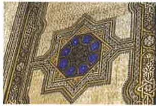
Detalle de una sinagoga judía

3 a Las juderías en ciudades españolas. Escucha las descripciones de tres barrios históricos judíos de tres ciudades españolas. Haz un resumen en español de los siguientes puntos en un párrafo de 80–90 palabras, usando tus propias palabras. Escribe en frases completas y verifica el trabajo con cuidado para asegurarte de que el lenguaje es correcto.