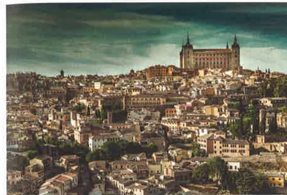
Una vista de Toledo con su alcázar

La derrota del último rey visigodo, Rodrigo, en el año 711, supuso el inicio de la dominación musulmana en la Península. La ciudad de Toledo fue tomada sin resistencia, comenzando así los 374 años de convivencia en la ciudad de musulmanes, cristianos y judíos, en lo que se ha denominado como periodo de las Tres Culturas.