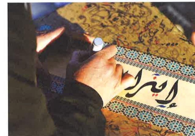
Escritura árabe en el zoco de Córdoba