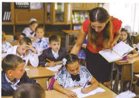
Una profesora con alumnos en un colegio español

2 a Lee las tres perspectivas en el artículo de revista sobre la integración en los centros escolares y completa el artículo, eligiendo las palabras adecuadas de la lista, según el sentido del texto. ¡Cuidado! Solo necesitas ocho.