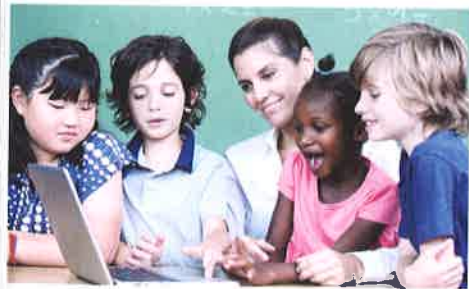
Un grupo de alumnos y su profesora de primaria