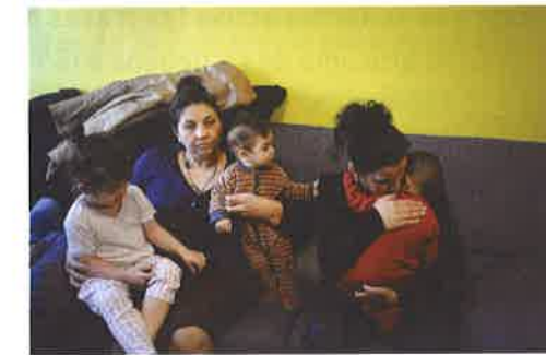
Tres generaciones gitanas: abuela, madre e hijas

Hace 30 años podía ser difícil que los niños gitanos fuesen a la escuela, pero hoy en día este derecho ya está garantizado por las leyes españolas y muchos gitanos están escolarizados en los centros educativos, lo que los convierte en lugares idóneos para compartir culturas. También muchos adultos gitanos, sobre todo mujeres, se están esforzando por mejorar sus niveles de lectura y escritura. No obstante, aún estamos lejos de conseguir una situación de normalización educativa del alumnado gitano en España. Se debe señalar que, del conjunto del alumnado gitano que comienza la educación secundaria, solo la finaliza el 20%.