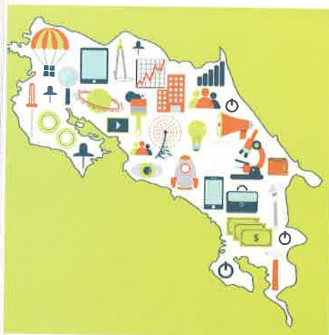
Mapa tecnológico de Costa Rica

Después de Chile y Uruguay, Costa Rica tiene el sistema tecnológico más competitivo y dinámico del subcontinente. Esto envía una señal importante a la comunidad tecnológica mundial sobre los esfuerzos que el país está realizando para mejorar. Costa Rica desea establecerse como un centro global para el sector digital y proyectar una imagen positiva sobre la competitividad del país. El impacto en la sociedad es muy significativo. Podrá reducir el analfabetismo gracias a más escuelas con aulas de informática, y más familias tendrán la posibilidad de usar Internet sin precios abusivos.