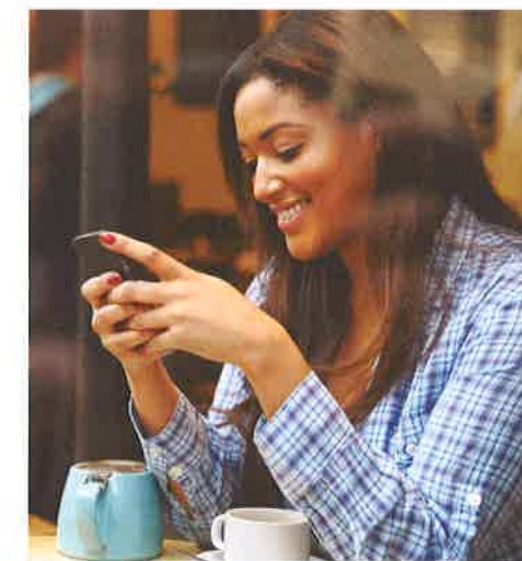
¡Enganchados al móvil!