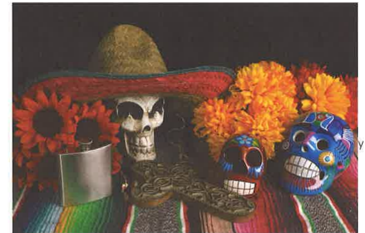
Altar en el Día de los Muertos

Vivo en Valladolid, en México. El Día de los Muertos siempre ha sido una gran celebración, muy importante y familiar en mi país. Ya se celebraba en los pueblos antes del siglo XVI y se convirtió en el Día de los Muertos después de la llegada de los españoles con su religión católica. El dos de noviembre visitamos el cementerio para adornar las lápidas de los familiares muertos. A veces hacemos un altar con flores bonitas de muchos colores y con fotos. Hay personas que prefieren hacer el altar en su casa y recordar a la persona muerta con chistes o anécdotas de su vida. La gente en mi país continúa siendo muy sentimental y familiar en su día a día. Hay varios símbolos importantes en el altar: las velas, las calaveras, que simbolizan la muerte, comida, normalmente la favorita del difunto, como tacos o enchiladas picantes y bebida, por lo general alcohólica, tequila o mezcal. Las familias celebran la muerte como algo normal que es parte de la vida también.