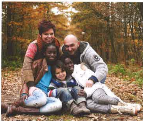
Una familia multicultural