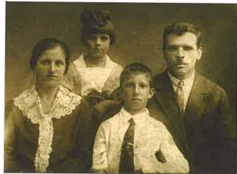
Una familia española en los años 60