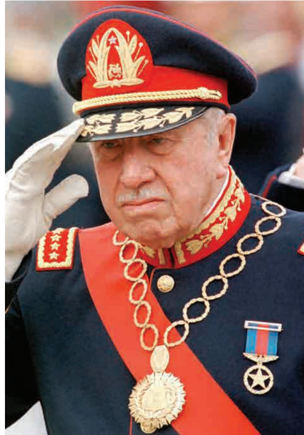
El dictador chileno Augusto Pinochet