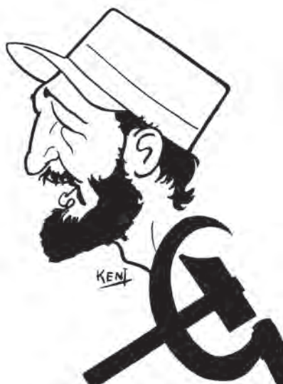
Caricatura de Fidel Castro