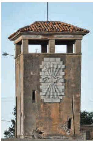
Yugo y flechas, vestigio del franquismo