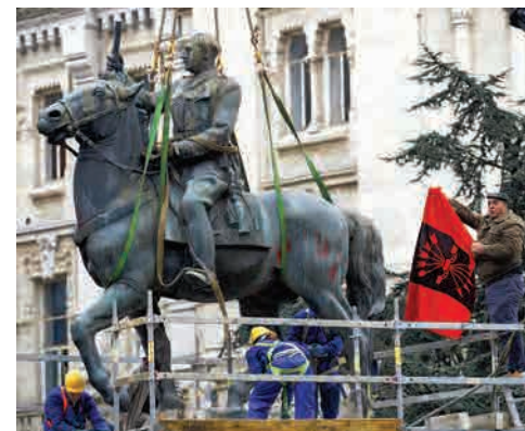
Retirada de una estatua de Franco en Santander mientras un hombre muestra una bandera franquista