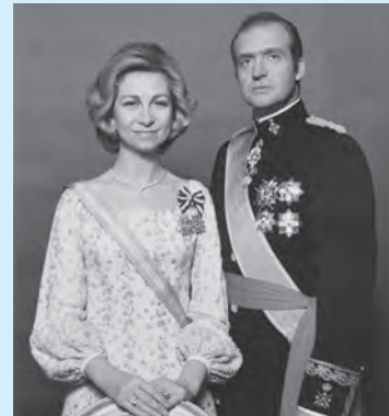
Los reyes Juan Carlos I y Sofía