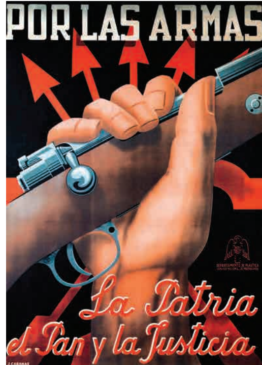
Publicidad franquista de la época

Se trata, pues, de un período oscuro para una mayoría de ciudadanos y ciudadanas que no se podían expresar libremente, y al mismo tiempo, permitía el enriquecimiento de algunos de los que estaban colaborando activamente con el régimen.