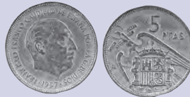
La peseta, moneda anterior al Euro en España, con simbología franquista

2 a Lee la descripción del franquismo luego selecciona la alternativa que mejor convenga para completar cada frase.