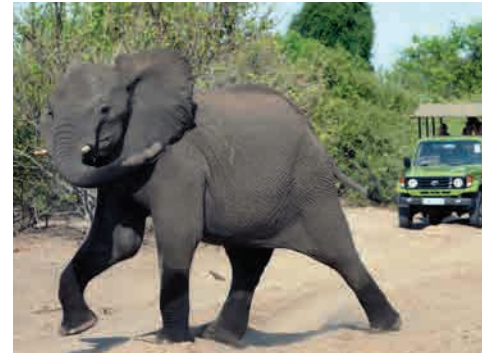
Un safari de caza similar al que asistió Juan Carlos I en 2012